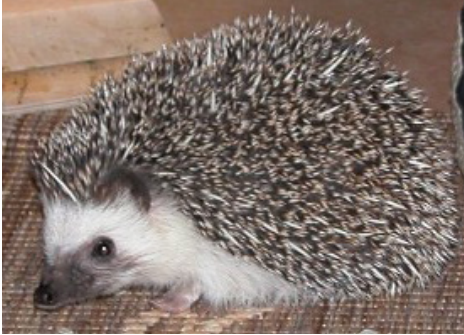
Erizo de vientre blanco.

No detectadas en Aragón Peligrosidad en Aragón: Media Oportunidad de actuación: Media