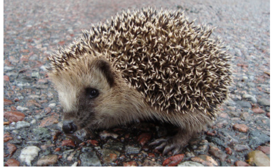
Erizo común ( Erinaceus europaeus ) para comparación.

BIOLOGÍA. El erizo de vientre blanco ( Atelerix albiventris ) es un pequeño erizo (15-25 cm), de color variable pero generalmente marrón o gris con espinas de color blanco o crema. Presenta nariz larga y ojos pequeños, sus patas son cortas y con sólo cuatro dedos. Su vientre es blanco y eso le da su nombre, su cara puede ser blanca o bien gris o negra. Se diferencia del erizo común sobre todo por su vientre blanco.