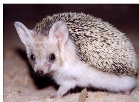
Erizo orejudo.

Ambos se utilizan como mascota y al menos en una ocasión se ha capturado un erizo del desierto en el medio natural de Aragón.