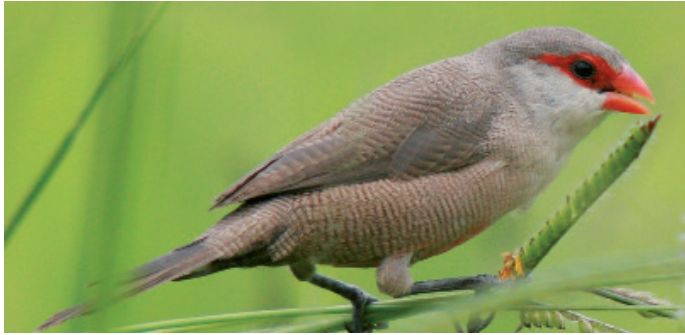
Estrilda astrild .

No está establecida en Aragón (citas esporádicas) Peligrosidad en Aragón: Alta Oportunidad de actuación: Alta