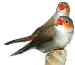
Estrilda troglodytes (arriba) y E. melpoda (abajo).