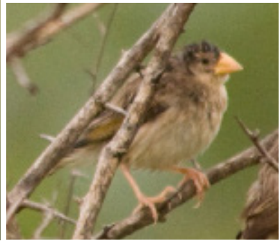
Euplectes afer .